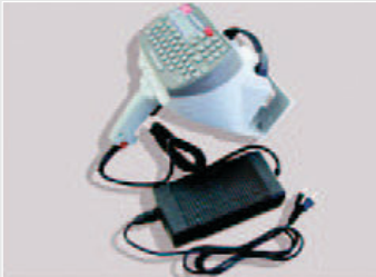
FlyMarker, mobil, netz