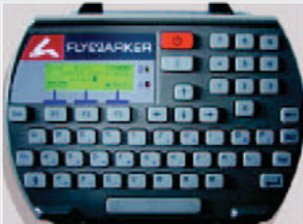
Display / Tastatur