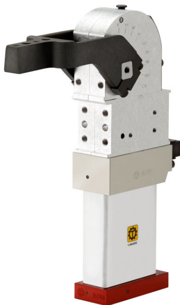
APH 50 B

Besonders der vermehrte Einsatz von Aluminiumdruckguss stellt das bisherige Spannkonzzept auf den Kopf. Nicht mehr eine definierte Spannlage sondern ein Lagetoleranzausgleich ist hier gefordert. Das Spannwerkzeug muss also in der Lage sein, die Dickentoleranzen des Bauteils von bis zu mehreren Zehntelmillimetern auszugleichen und gleichzeitig eine möglichst konstante Spannkraft aufbringen. Außerdem besteht die Forderungen nach einer Sicherheitsverriegelung bei einer Not-Stopp Situation. Beide Anforderungen erfüllt der neue TÜNKERS ALPHA mit integrierter Bremse.