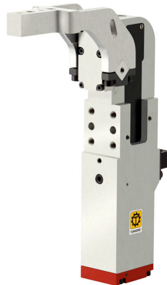
APH 40 B

Statt mit einem Kniehebelsystem ist der ALPHA-Spanner mit einer Kurvenmechanik ausgerüstet. Diese Kurvenmechanik bewirkt in einem Arbeitsbereich von ca. 3mm eine konstante Kraftverstärkung der Zylinderkraft um ca. 1:8.