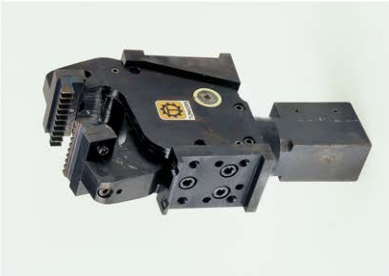
Hydraulikzange zum Wellenpragen.jpg