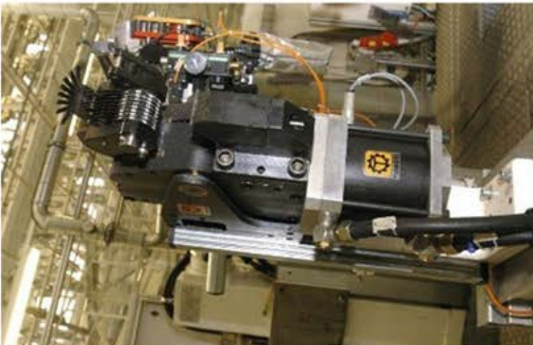
Zange mit Raderpragewerk.jpg