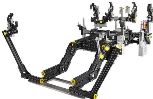
Der Grundrahmen lässt sich variabel aufbauen und erweitern