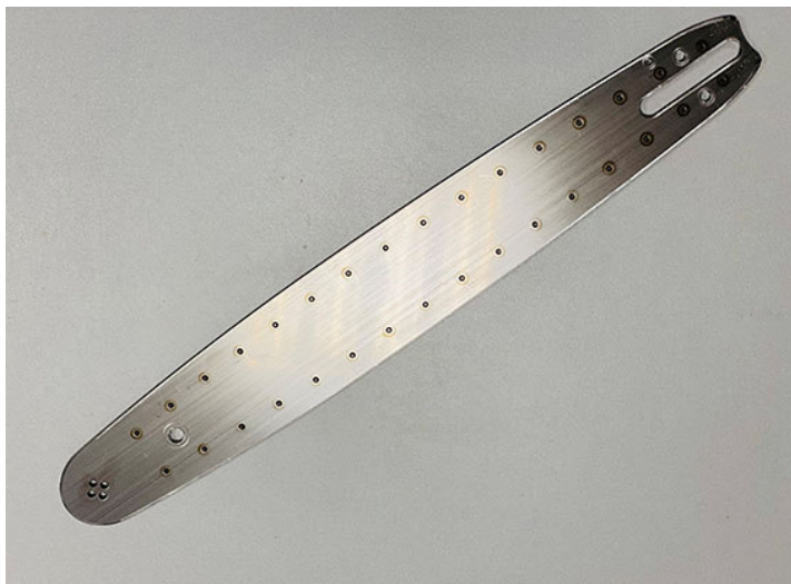
Abb. 4: Eine Führungsschiene für eine Motorsäge, bei der die vielen Schweißverbindungen noch gut zu erkennen sind.