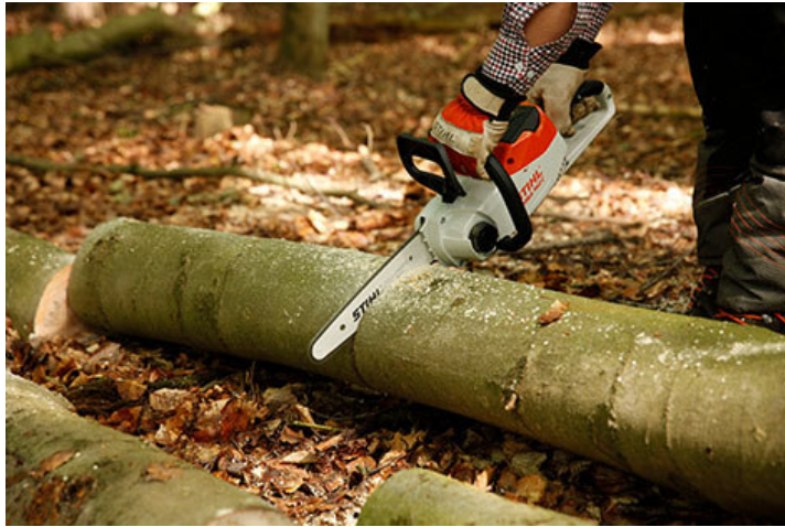
Abb. 5: STIHL ist seit mehr als 50 Jahren der weltgrößte Anbieter von Motorsägen. Für deren Sägekette ist die Führungsschiene das Bindeglied zwischen Motorleistung und Sägekette.