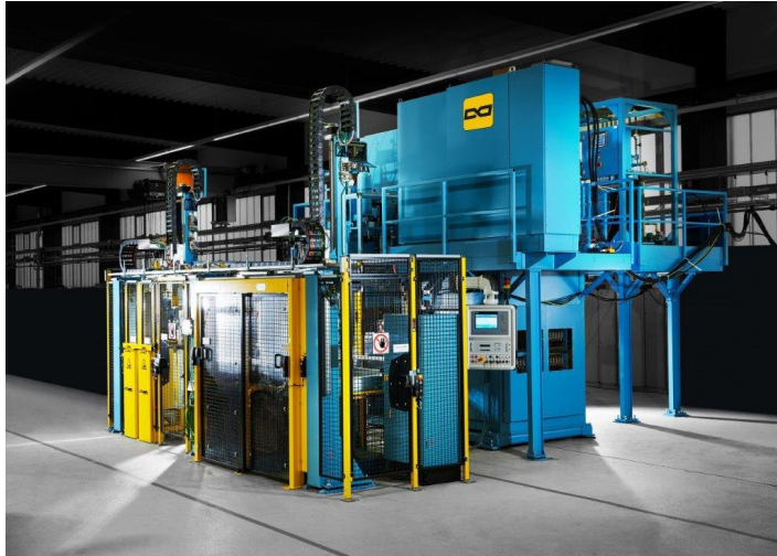
Abb. 1: Die Portal-Buckelschweißanlage von NIMAK, die im US-Werk von STIHL Führungsschienen für Motorsägen produziert. Vollautomatisiert fügt eine Buckelpresse die jeweils drei dafür erforderlichen Bleche.