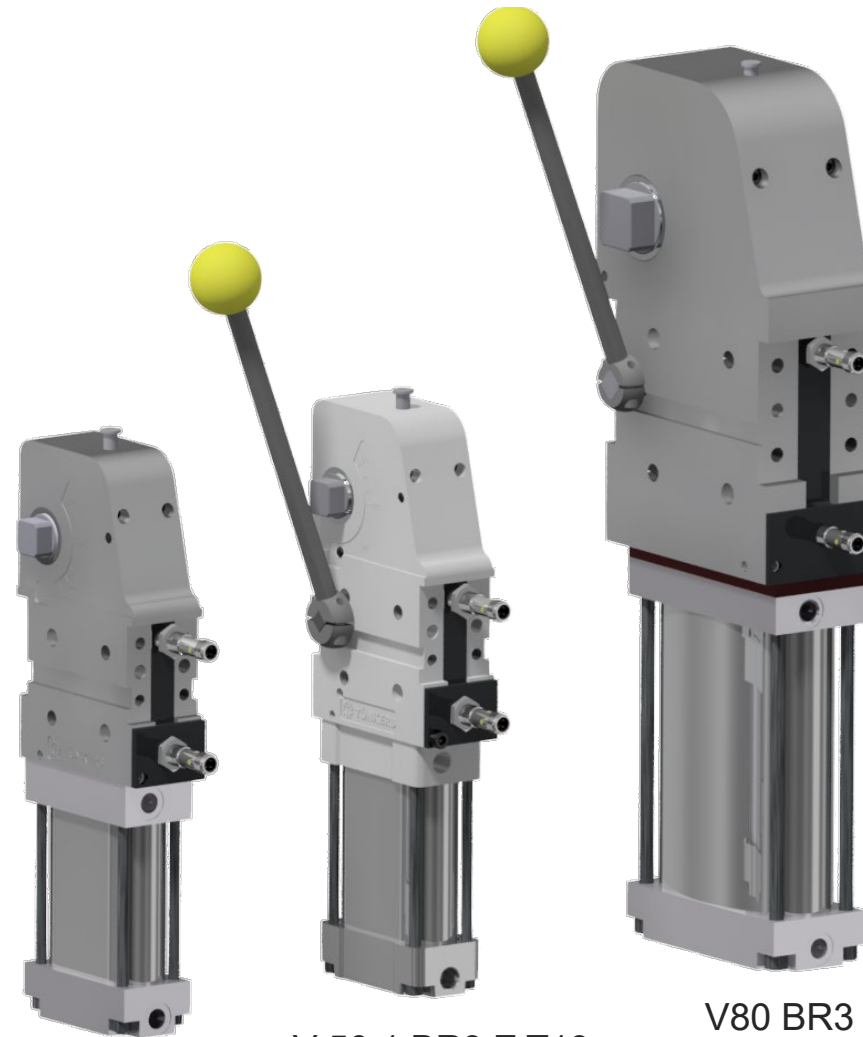
V 50.1 BR3 T13

Die Übertotpunktverriegelung wird durch den Sensor sicher abgefragt. In dieser Stellung ist der Spanner sicher verriegelt und kann durch externe Lasten nicht geöffnet werden.